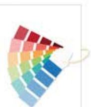
رستاک / Rastak