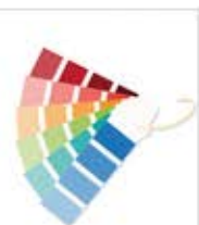
سوشیا / Sooshia