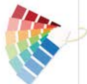
وِرونا / Verona

■ با توجه به اینکه شرکت نفت ابزار مجهز به خط رنگ و چاپ پیشرفته می باشد، انتخاب رنگ با شما اجرا با ما، (رنگ ها در طیف رنگ های انتخابی نرمال بدون هزینه اضافه می باشد)