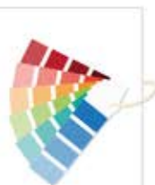
ورونا / Verona