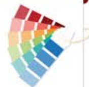
وِستا / Vista