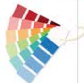
رخشان / Rakhshan (چهار نازل)