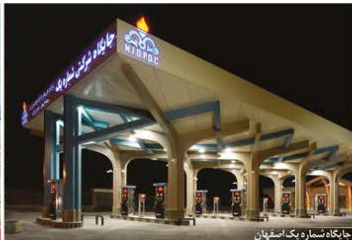
جایگاه شماره یک اصفهان