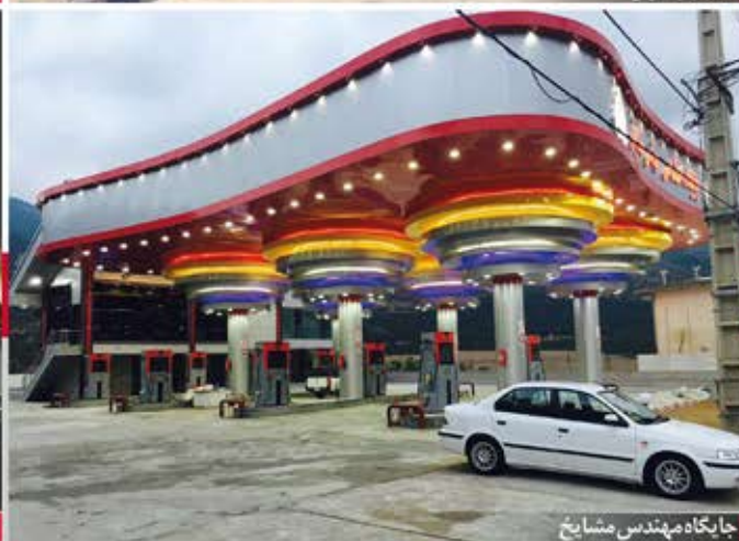
جایگاه مهندس مشایخ