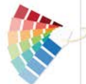
شایا / Shaya (دو نازل)